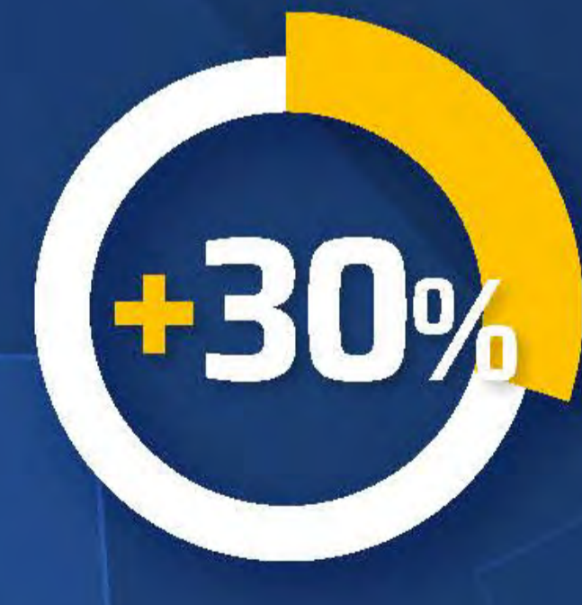
Huolto- ja varaosamyynti